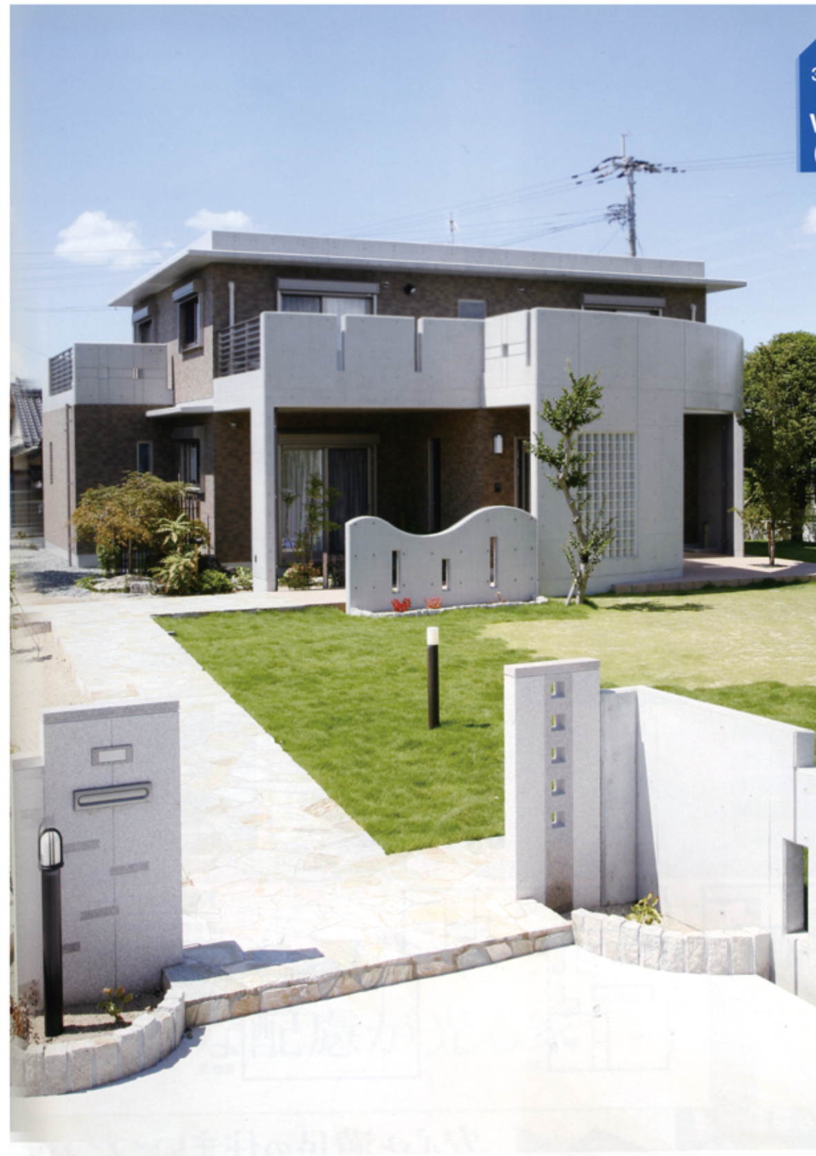
【上】車や飛行機のように外圧を面全体に分散してバランスよく受け止める、モノコック構造による強固な造り 【下】「家の造りとエコキュートの相乗効果で、電気代はなんと以前の半分に以下」と奥様

のどかな田園風景の向こうに八代海が広がるこの一帯は、遮るモノがないため夏場も風が通りエアコン要らず。それだけに台風の被害は甚大で、「実家に居た頃何度も台風に遭い、怖い思いをしました。飛んできた物が壁に刺さり窓は割れ、その風圧で屋根が浮き、家の中の物も全部飛んで行ってしまっった。そんなSさんが選んだのは、台風による飛来物にはもちろん、地震や火事にも強い強化コンクリートによるRCの家。世界特許も取得した断熱仕上材の型枠化で躯体内の結露がなく、魔法瓶のような断熱性を持ちながらも、木造並みのコストパフォーマンスを実現。高層ビルも手掛ける同社の技術が随所に生かされた、快適で高級感あふれる住まいが誕生した。