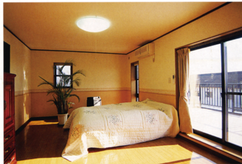
◀寝室は窓が大きく、とても明るい部屋に。左手奥に大きなウォークインクローゼットがあり、収納もたっぷりなので部屋をスッキリと使えます

●株式会社中野工務店 ●本社・支店所在地/本社〒869-0633下益城郡小川町新田1914-1 ☎0964-43-0250 福岡営業所〒811-1303福岡市南区折立町2-2 ☎092-591-6060 長崎営業所〒850-0836長崎市小島町2-9-2 ☎1006 ☎095-823-5381 ●許可番号/建築業許可熊本県知事(特-13)第115号 ●取扱工法/鉄筋コンクリート造 ●E-mailアドレス/nakano-@mx21.tki.ne.jp