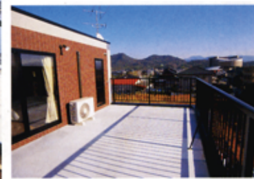
▼3階にある寝室に面したバルコニー。この部分にもうひとつ部屋作れるのでは、という広さ。眺めがよく、「ここでひと息つくこと、心からゆったりできる」とご主人