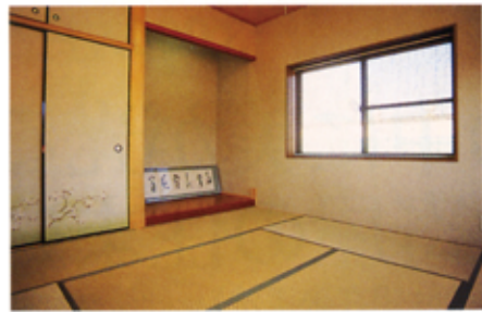
▲シンプルな造りの8帖の和室。コンクリートの住まいは無機質だと思われがちですが、中は木造と変わらない温かな部屋造りができます