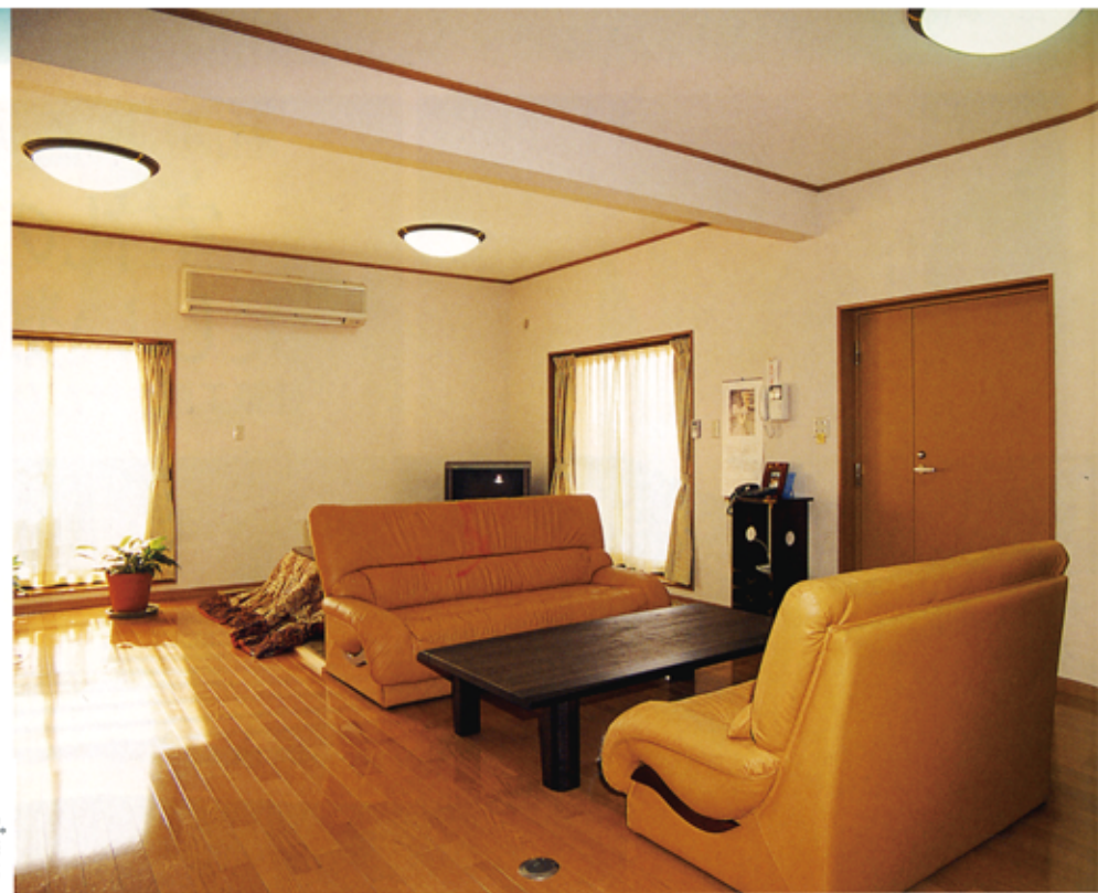
▶天井が高く、広いリビング。ソファ奥が置コーナーで茶の間の隅につくられるように工夫