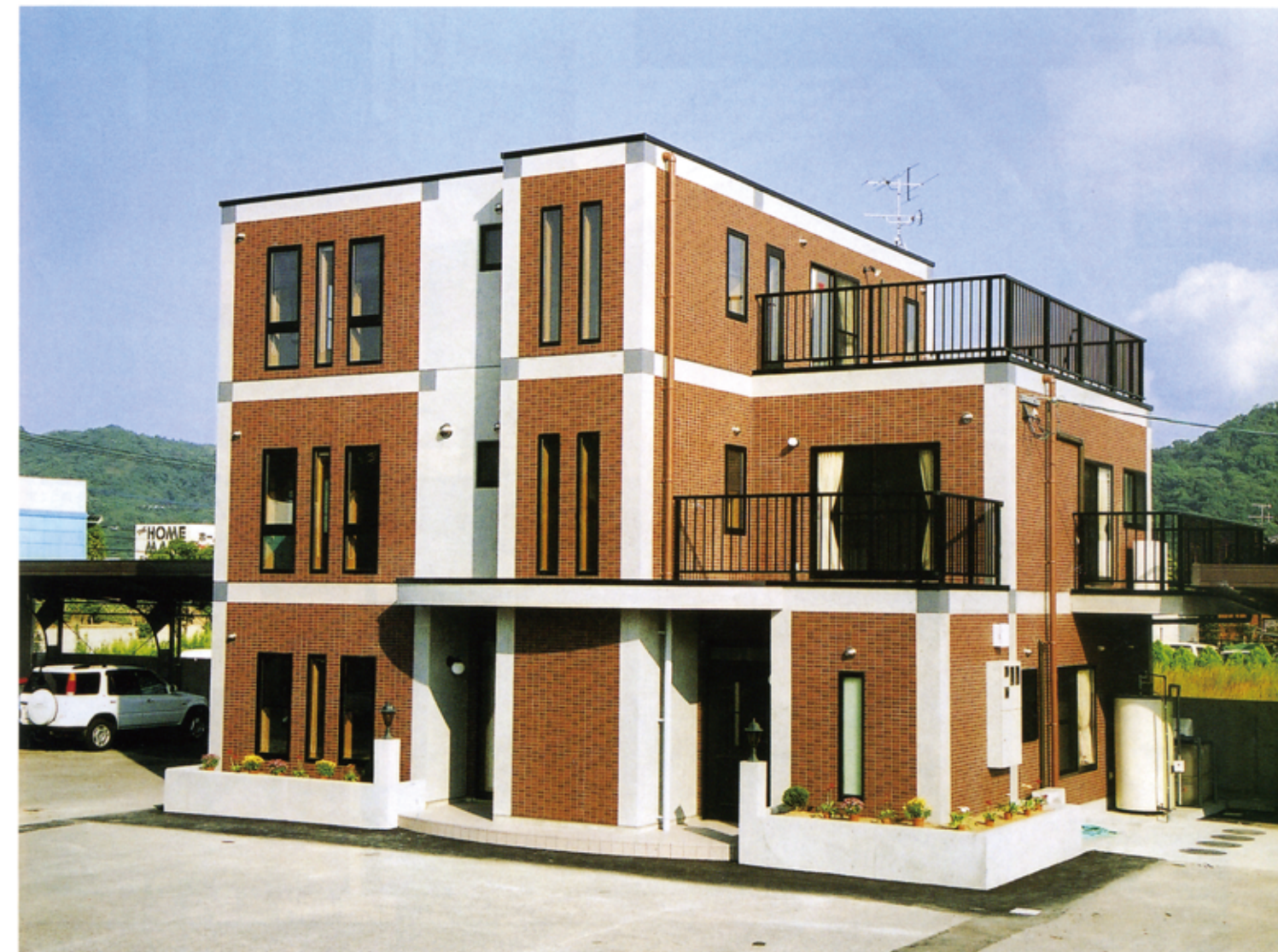
▲外観は、コンクリートの打ちっ放しとタイル張り部分をデザイン的に配し、表情に変化を